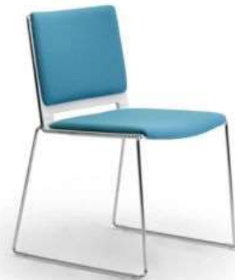
BRE.MEN KU DeLux