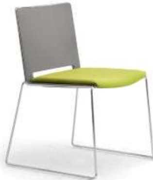
BRE.MEN KU SI